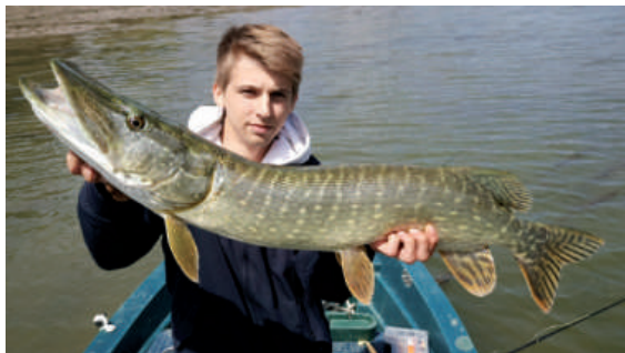
Brochet pris en Seine au leurre